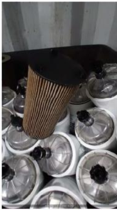
FOTO DO FILTRO SEPARADOR DE ÁGUA VELHO