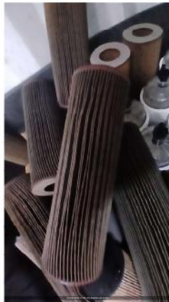
FOTO DO FILTRO DE ÓLEO LUBRIFICANTE VELHO

REALIZADO TROCA DO FILTRO DE ÁGUA NÃO SE APLICA