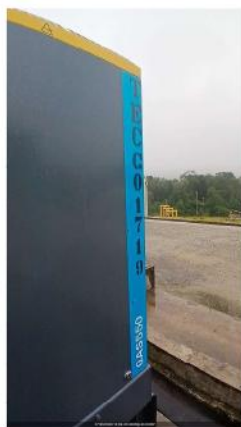
FOTO IDENTIFICAÇÃO DO PATRIMONIO