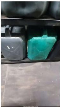
FOTO DO ÓLEO LUBRIFICANTE VELHO

REALIZADO TROCA DO OLEO LUBRIFICANTE? SIM