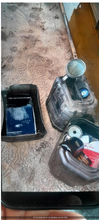
FOTO DO ÓLEO LUBRIFICANTE VELHO

CASO POSSUA QTA INTERNO, VERIFICAR O FUNCIONAMENTO