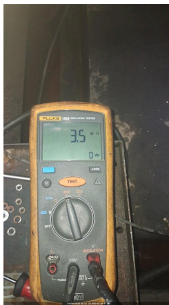
FOTO DA EVIDENCIA NO MEGOMETRO