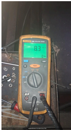
FOTO DA EVIDENCIA NO MEGOMETRO