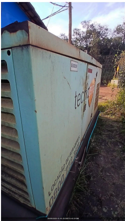
FOTO LATERAL ESQUERDA