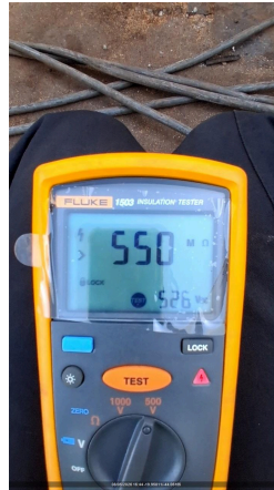
FOTO DA EVIDENCIA NO MEGOMETRO