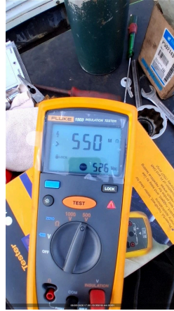
FOTO DA EVIDENCIA NO MEGOMETRO