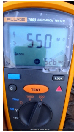
FOTO DA EVIDENCIA NO MEGOMETRO