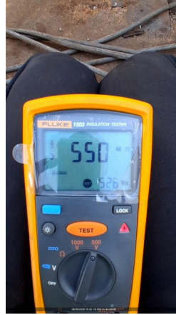
FOTO DA EVIDENCIA NO MEGOMETRO