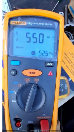
FOTO DA EVIDENCIA NO MEGOMETRO