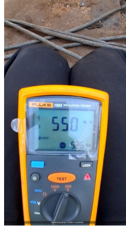
FOTO DA EVIDENCIA NO MEGOMETRO