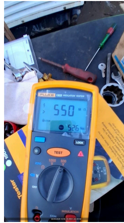
FOTO DA EVIDENCIA NO MEGOMETRO