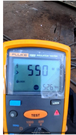
FOTO DA EVIDENCIA NO MEGOMETRO