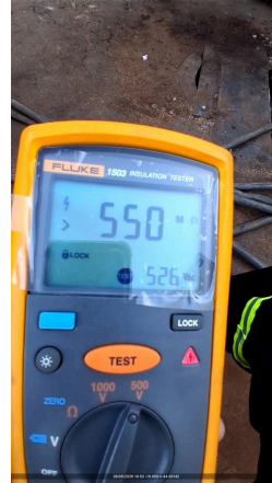
FOTO DA EVIDENCIA NO MEGOMETRO