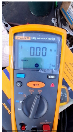
FOTO DA EVIDENCIA NO MEGOMETRO