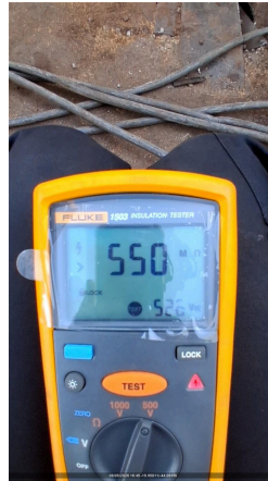
FOTO DA EVIDENCIA NO MEGOMETRO