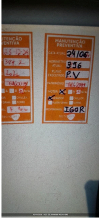
FOTO IDENTIFICAÇÃO DO PATRIMONIO