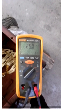
FOTO DA EVIDENCIA NO MEGOMETRO