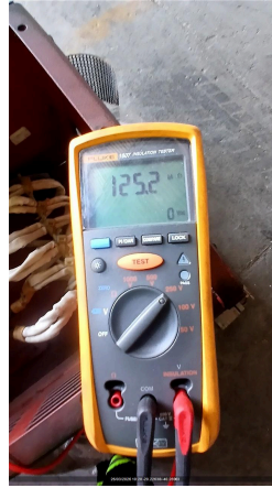
FOTO DA EVIDENCIA NO MEGOMETRO