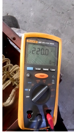
FOTO DA EVIDENCIA NO MEGOMETRO