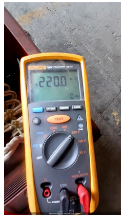
FOTO DA EVIDENCIA NO MEGOMETRO