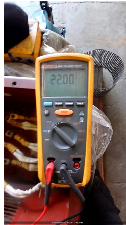
FOTO DA EVIDENCIA NO MEGOMETRO