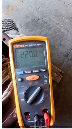
FOTO DA EVIDENCIA NO MEGOMETRO