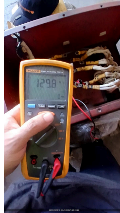
FOTO DA EVIDENCIA NO MEGOMETRO