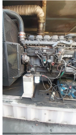
FOTO DOS FILTROS