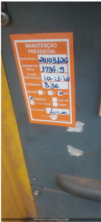
FOTO DO HORIMETRO