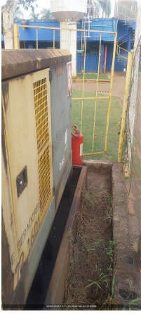
FOTO DA ETIQUETA DE VALIDADE DO EXTINTOR