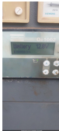
FOTO DO CONTROLADOR COM O VALOR DE TENSÃO DA BATERIA