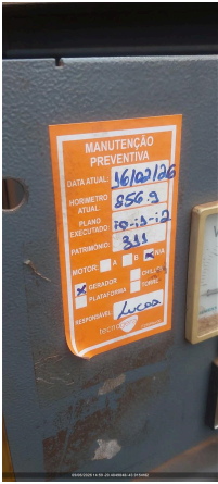
FOTO DO HORIMETRO