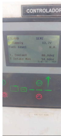
FOTO DO CONTROLADOR COM O VALOR DE TENSÃO DA BATERIA