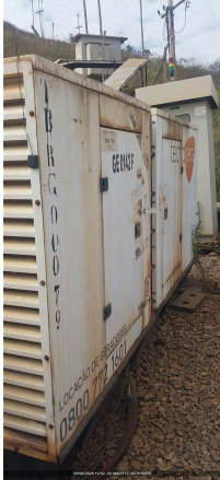
FOTO LATERAL ESQUERDA