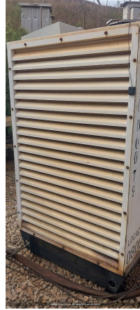
FOTO LATERAL DIREITA