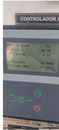
FOTO DO CONTROLADOR COM O VALOR DE TENSÃO DA BATERIA