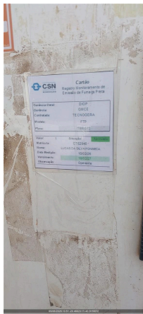
FOTO ESCALA RINGELMANN