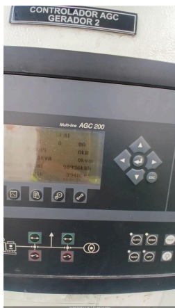
FOTO DO HORIMETRO