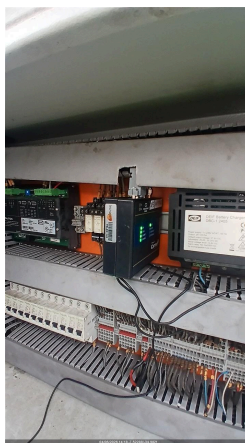
FOTO DO HORIMETRO