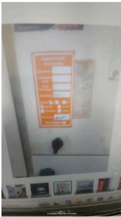
FOTO IDENTIFICAÇÃO DO PATRIMONIO