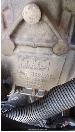
Nº DE SERIE DO MOTOR