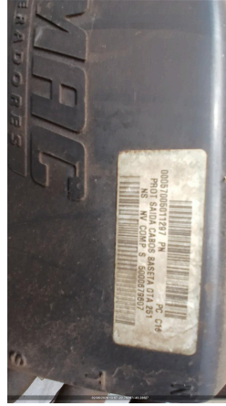
Nº DE SERIE DO ALTERNADOR