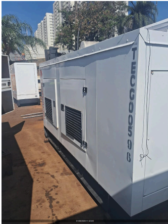
FOTO LATERAL ESQUERDA