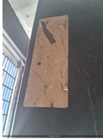
Nº DE SERIE DO ALTERNADOR