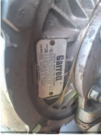
Nº DE SERIE DO MOTOR