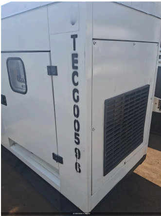
Nº DE SERIE DO EQUIPAMENTO