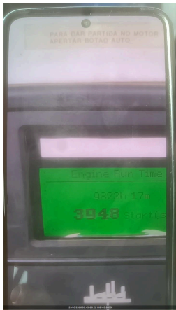
FOTO DO HORIMETRO