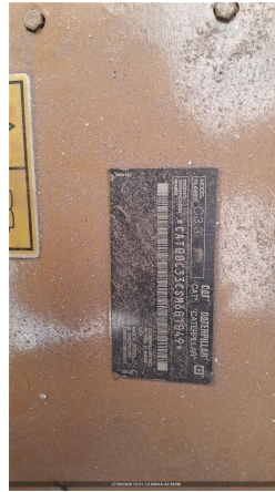
FOTO IDENTIFICAÇÃO DO PATRIMONIO