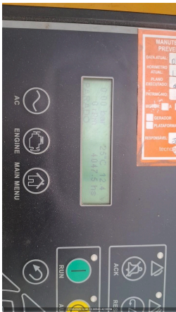
FOTO DO HORIMETRO

CERTIFICO QUE A BACIA DE CONTENÇÃO DO TANQUE(INTERNO/EXTERNO) ESTÁ COM DRENO FECHADO E BUJÃO FIXADO. OK