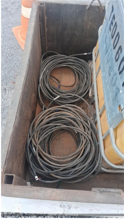
FOTO GERAL DOS CABOS

FICARAM CABOS SOB RESPONSABILIDADE DO CLIENTE? SIM