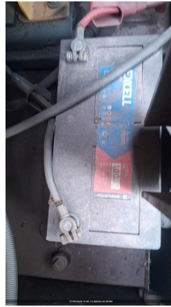
FOTO DA BATERIA