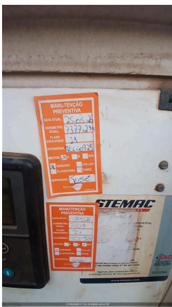
FOTO IDENTIFICAÇÃO DO PATRIMONIO