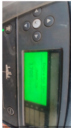
FOTO DO HORIMETRO