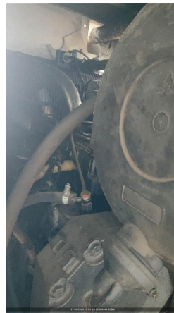
FOTO DOS FILTROS

QUAIS OS PROBLEMAS IDENTIFICADOS NO MOTOR? VAZAMENTO NO RETENTOR DO VOLAN