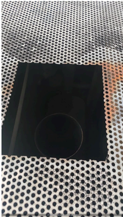
FOTO DO ACUMULO DE FULIGEM E PRESENÇA DE RESÍDUOS DE QUEIMA NO ESCAPAMENTO

HÁ ACUMULO DE FULIGEM E PRESENÇA DE RESÍDUOS DE QUEIMA? NÃO