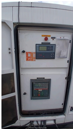
FOTO DO HORIMETRO