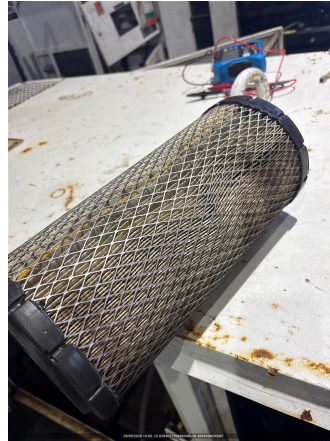
FOTO DOS FILTROS

QUAIS OS PROBLEMAS IDENTIFICADOS NO MOTOR? Não foi possível fazer uma ava