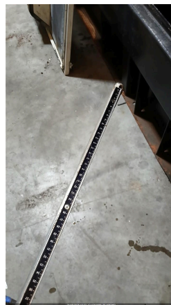
FOTO DO NIVEL DE OLEO