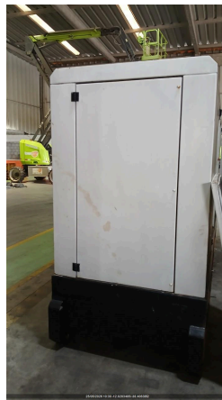
FOTO LATERAL ESQUERDA