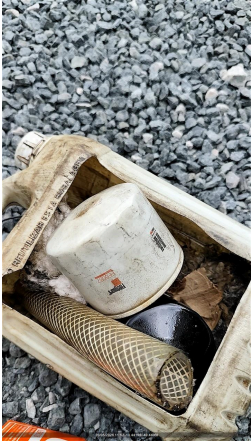
FOTO DO FILTRO SEPARADOR DE ÁGUA VELHO

FOTO DA MARCAÇÃO DA DATA DA TROCA NO FILTRO SEPARADOR DE ÁGUA