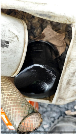
FOTO DO FILTRO DE ÓLEO LUBRIFICANTE VELHO

REALIZADO TROCA DO FILTRO DE ÁGUA NÃO SE APLICA