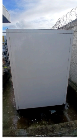
FOTO LATERAL DIREITA