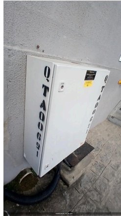
FOTO IDENTIFICAÇÃO DO PATRIMONIO