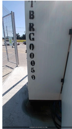
FOTO IDENTIFICAÇÃO DO PATRIMONIO