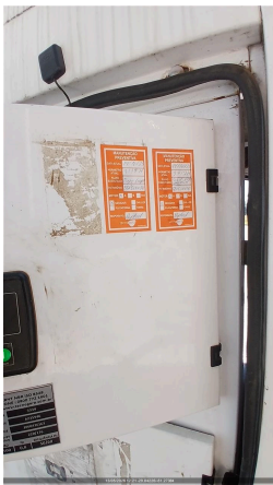
FOTO DO HORIMETRO