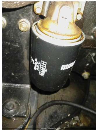
FOTO DOS FILTROS

QUAIS OS PROBLEMAS IDENTIFICADOS NO MOTOR?