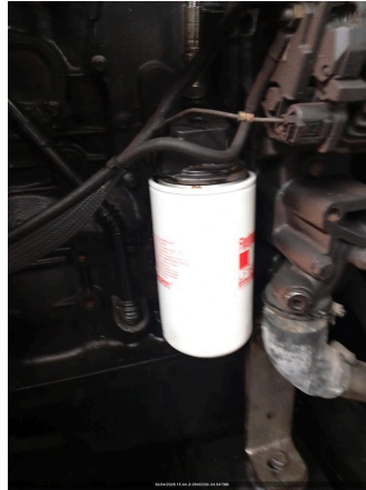
FOTO DOS FILTROS

QUAIS OS PROBLEMAS IDENTIFICADOS NO MOTOR?