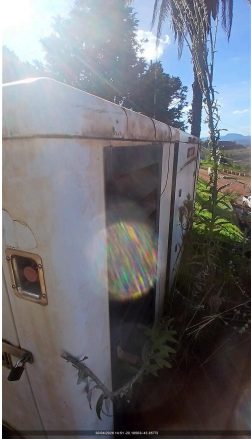
FOTO LATERAL ESQUERDA