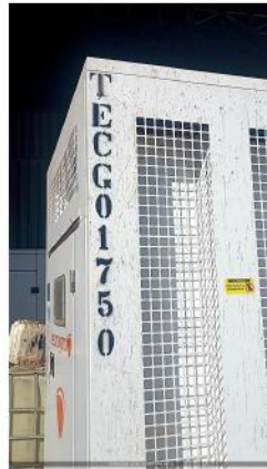
FOTO DO HORIMETRO