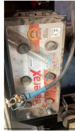
FOTO DA ETIQUETA DA BATERIA PREENCHIDA