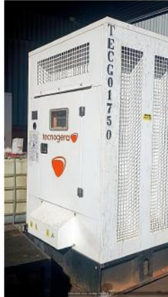
FOTO LATERAL DIREITA