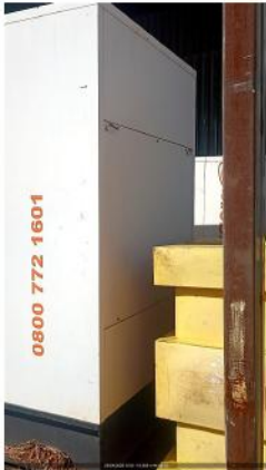
FOTO LATERAL ESQUERDA