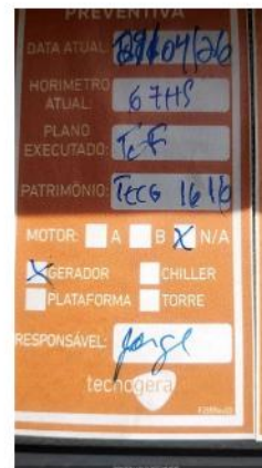
FOTO DO HORIMETRO