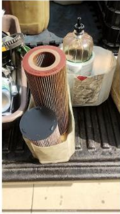
FOTO DA MARCAÇÃO DA DATA DA TROCA NO FILTRO LUBRIFICANTE

FOTO DO FILTRO DE ÓLEO LUBRIFICANTE VELHO