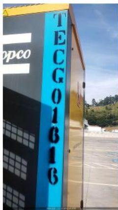
FOTO IDENTIFICAÇÃO DO PATRIMONIO