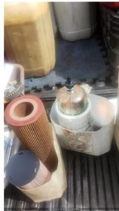
FOTO DO FILTRO SEPARADOR DE ÁGUA VELHO