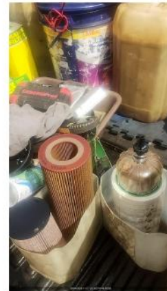
FOTO DA MARCAÇÃO DA DATA DA TROCA NO FILTRO SEPARADOR DE ÁGUA