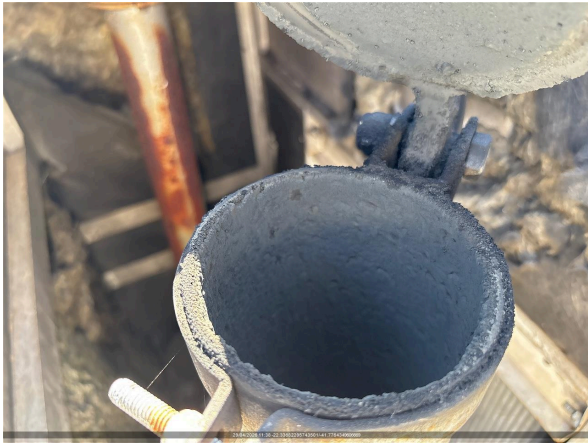
FOTO DO ACUMULO DE FULIGEM E PRESENÇA DE RESÍDUOS DE QUEIMA NO ESCAPAMENTO

HÁ ACUMULO DE FULIGEM E PRESENÇA DE RESÍDUOS DE QUEIMA? SIM