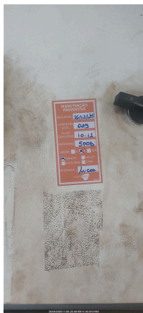
FOTO IDENTIFICAÇÃO DO PATRIMONIO