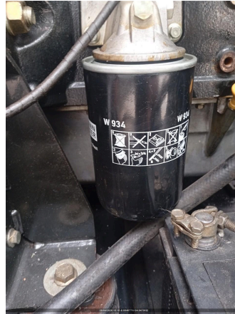
FOTO DOS FILTROS