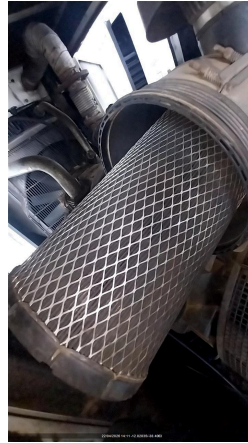
FOTO DOS FILTROS

QUAIS OS PROBLEMAS IDENTIFICADOS NO MOTOR? BLOCO DO MOTOR ESTOURADO