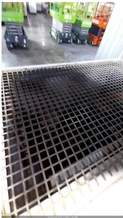
FOTO DO ACUMULO DE FULIGEM E PRESENÇA DE RESÍDUOS DE QUEIMA NO ESCAPAMENTO

HÁ ACUMULO DE FULIGEM E PRESENÇA DE RESÍDUOS DE QUEIMA? SIM