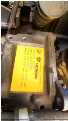
Nº DE SERIE DO MOTOR