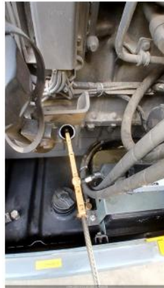
FOTO ESCALA RINGELMANN