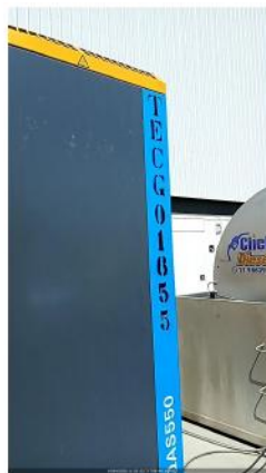
FOTO IDENTIFICAÇÃO DO PATRIMONIO