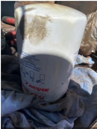
FOTO DO FILTRO SEPARADOR DE ÁGUA VELHO

FOTO DA MARCAÇÃO DA DATA DA TROCA NO FILTRO SEPARADOR DE ÁGUA