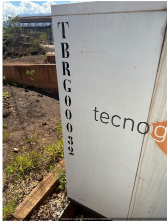
FOTO IDENTIFICAÇÃO DO PATRIMONIO