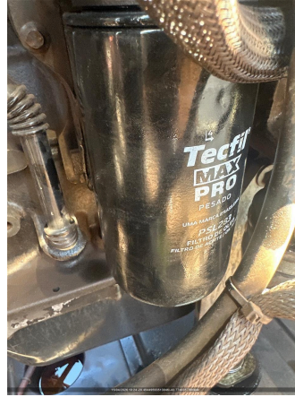
FOTO DO FILTRO DE ÓLEO LUBRIFICANTE VELHO

FOTO DA MARCAÇÃO DA DATA DA TROCA NO FILTRO LUBRIFICANTE