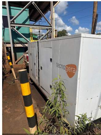
FOTO LATERAL DIREITA