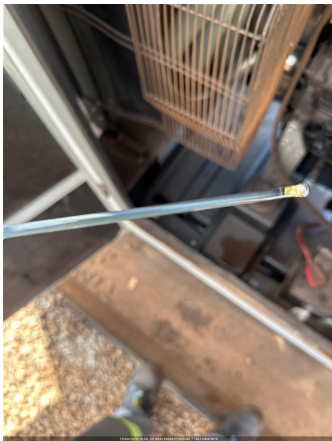
FOTO DA VARETA DE ÓLEO LUBRIFICANTE