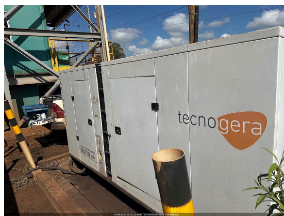
FOTO LATERAL DIREITA