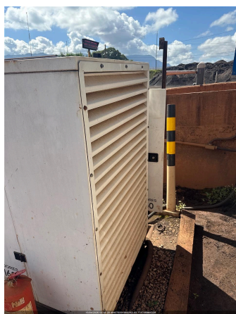
FOTO LATERAL ESQUERDA