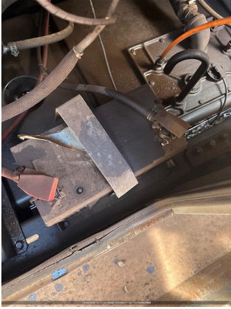
FOTO DA DATA DE FABRICAÇÃO E VALIDADE DA BATERIA

CASO APLICAVEL COMPLETAR AGUA DA BATERIA NA