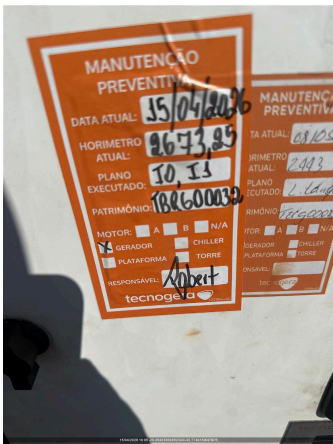
FOTO DO HORIMETRO