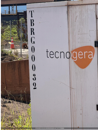
FOTO IDENTIFICAÇÃO DO PATRIMONIO