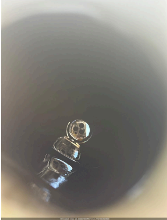
FOTO DO ÓLEO LUBRIFICANTE VELHO

CASO POSSUA QTA INTERNO, VERIFICAR O FUNCIONAMENTO