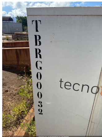
FOTO IDENTIFICAÇÃO DO PATRIMONIO