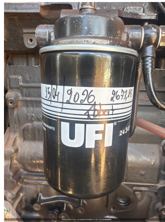
FOTO DO FILTRO DE COMBUSTÍVEL VELHO

FOTO DA MARCAÇÃO DA DATA DA TROCA NO FILTRO DE COMBUSTÍVEL