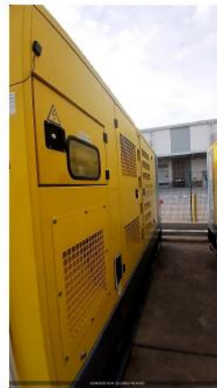
FOTO LATERAL ESQUERDA