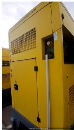
FOTO LATERAL DIREITA