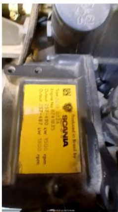
Nº DE SERIE DO MOTOR