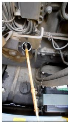
FOTO ESCALA RINGELMANN