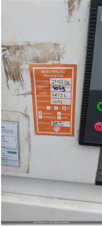
FOTO DO HORIMETRO