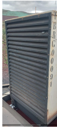
FOTO LATERAL DIREITA