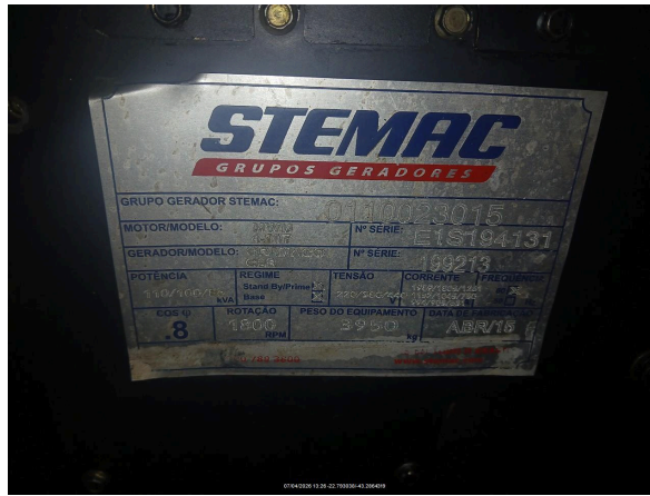
Nº DE SERIE DO ALTERNADOR