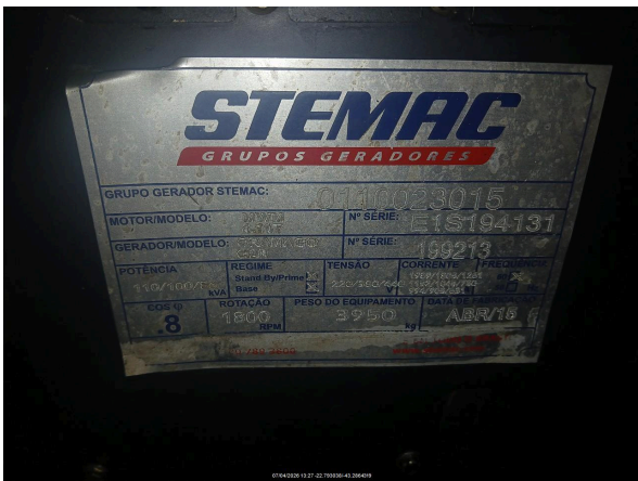
Nº DE SERIE DO EQUIPAMENTO