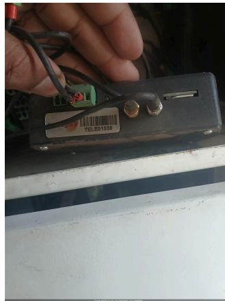
FOTO DA TELEMETRIA