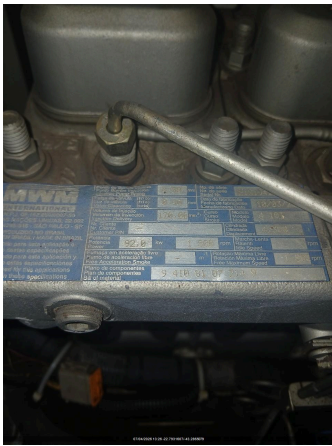
Nº DE SERIE DO MOTOR