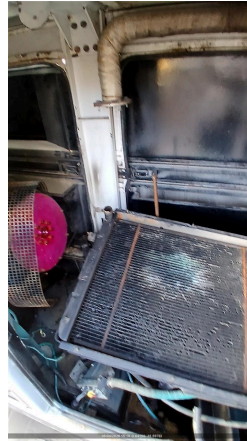
FOTO DOS FILTROS

QUAIS OS PROBLEMAS IDENTIFICADOS NO MOTOR? Retirado para conserto