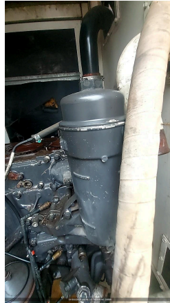
FOTO DOS FILTROS

QUAIS OS PROBLEMAS IDENTIFICADOS NO MOTOR? MOTOR TRAVADO.