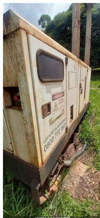
FOTO LATERAL ESQUERDA