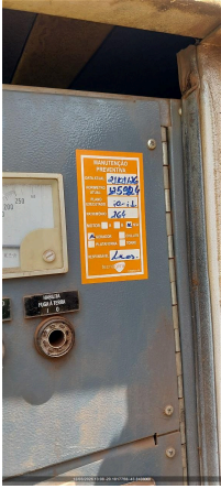
FOTO DO HORIMETRO