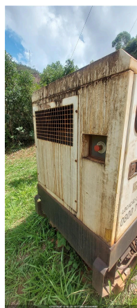
FOTO LATERAL DIREITA