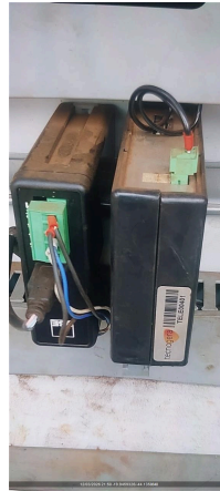
FOTO DO HORIMETRO