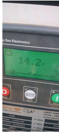
FOTO DO CONTROLADOR COM O VALOR DE TENSÃO DA BATERIA