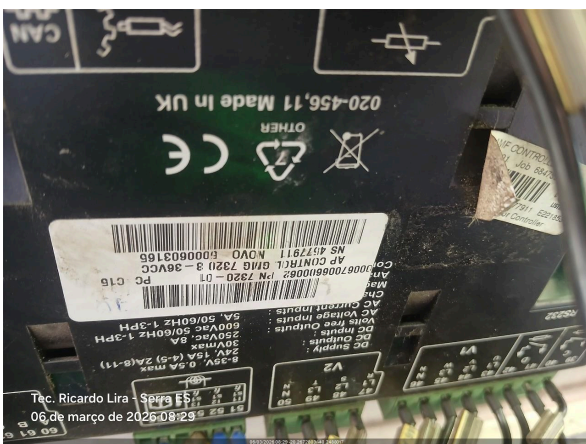
Tec. Ricardo Lira - Serra ES 06 de março de 2026 08:29