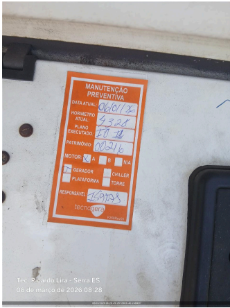
Tec. Ricardo Lira - Serra ES 06 de março de 2026 08:28