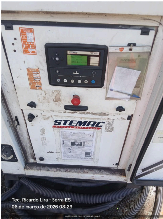
Tec. Ricardo Lira - Serra ES 06 de março de 2026 08:29