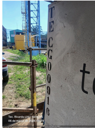
Tec. Ricardo Lira - Serra ES 06 de março de 2026 08:29