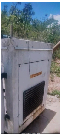
FOTO DO HORIMETRO