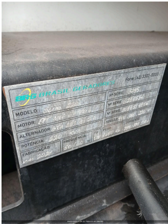
Nº DE SERIE DO EQUIPAMENTO