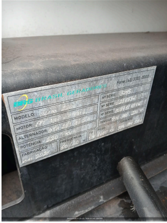
Nº DE SERIE DO MOTOR