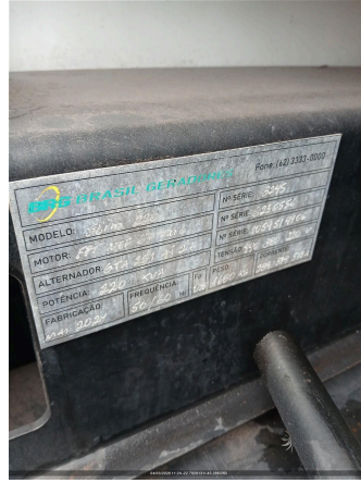
Nº DE SERIE DO ALTERNADOR