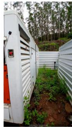
FOTO LATERAL ESQUERDA